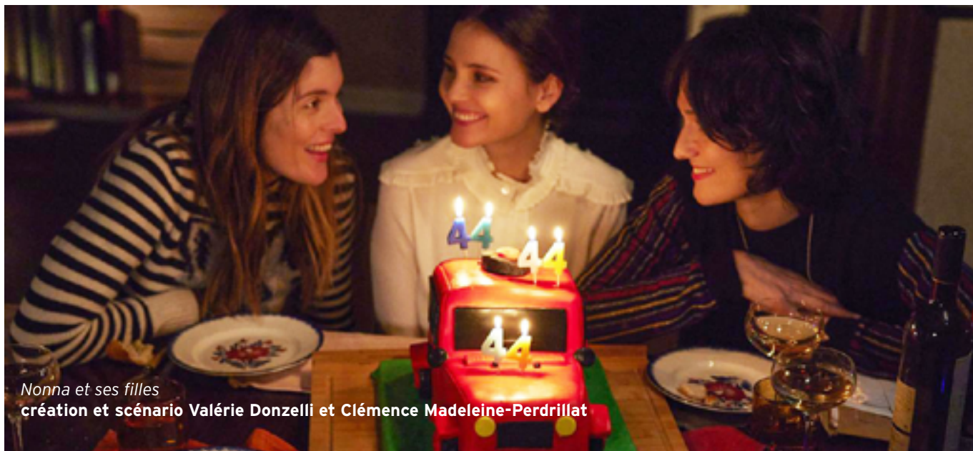
Nonna et ses filles création et scénario Valérie Donzelli et Clémence Madeleine-Perdrillat

À l'issue de ces entretiens, la commission délibère et sélectionne - en fonction des places disponibles - les candidats identifiés comme les plus à même d'atteindre les objectifs de la formation et ceux pour lesquels la formation sera le plus bénéfique.